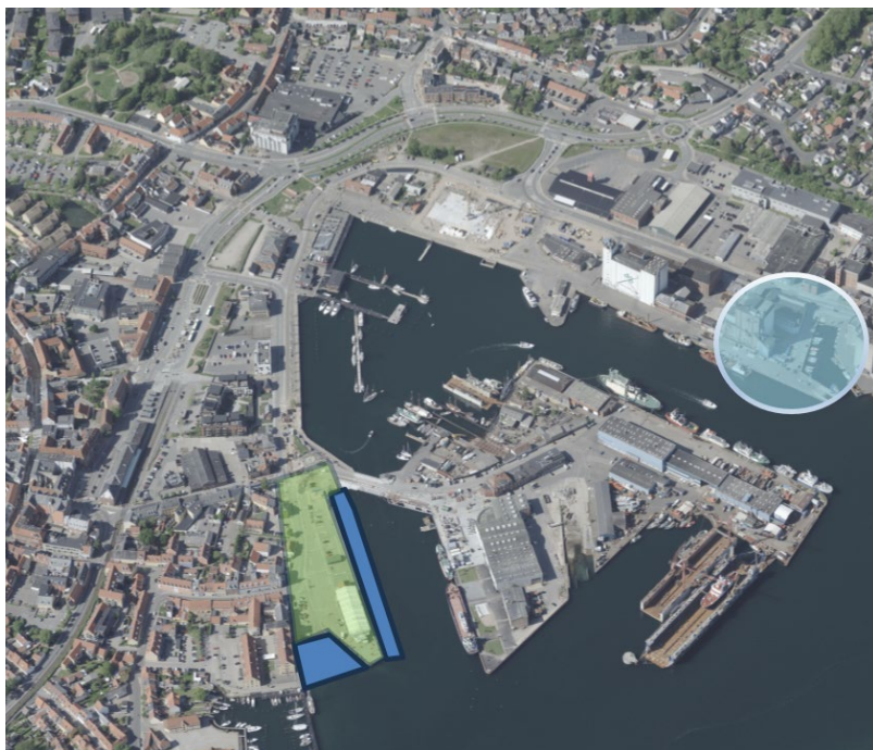
Figur 1 Kortdiagram med indikation af de tre scenarier. Scenarie markeret med grønt, scenarie 2 markeret med blå og scenarie 3 markeret med lyseblå.

Svendborg Kommune arbejder selv med en udskiftning af Højstenefærgeren til en el-dreven færge. Den nye færge forventes at blive med samme kapacitet som den nuværende færge.